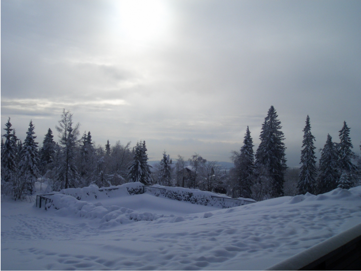
January 2009