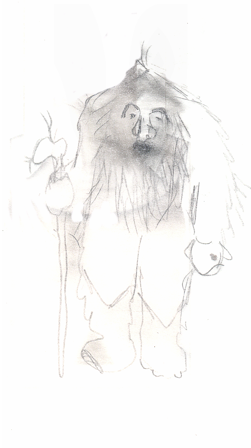
Drawing made by Pia Berg