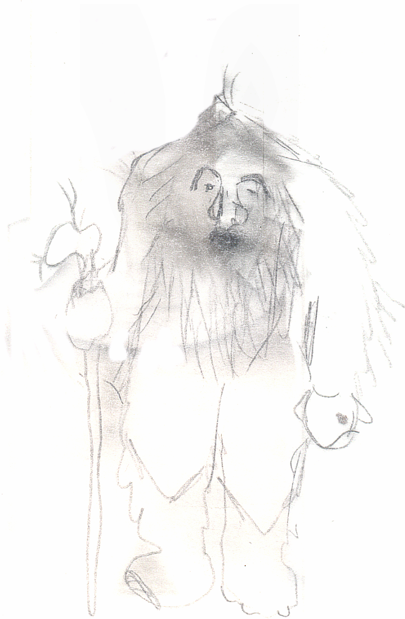
Tegning af Pia Berg