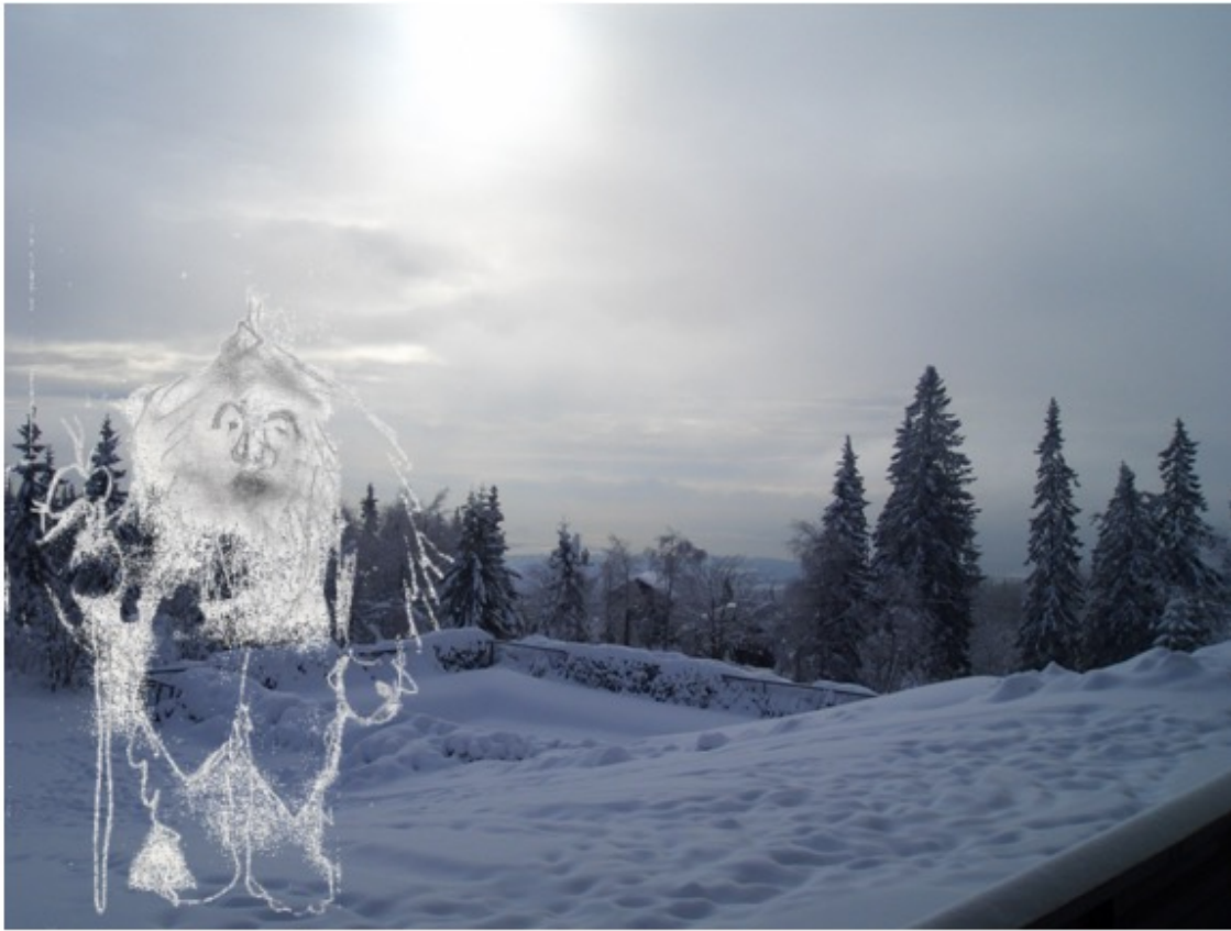
Fotocollage af Pia Berg, 2009